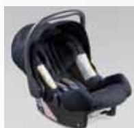
Baby Safe Plus F410EYA103 Isofix

Di questo non si discute nemmeno: troverete il sedile adatto presso il garage Emil Frey. Domandateci consiglio – anche noi ci teniamo alla sicurezza dei vostri bambini!