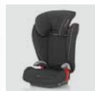
Römer KID plus