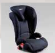
KID Plus F410EYA214