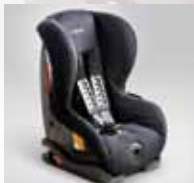
Duo Plus F410EYA002 Isofix