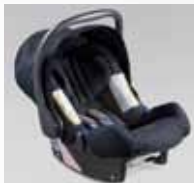
Baby Safe Plus F410EYA103 Isofix

Keine Frage: Den richtigen Kindersitz finden Sie bei Ihrer Emil Frey Garage. Lassen Sie sich fachmännisch beraten – die Sicherheit Ihrer Kinder liegt auch uns am Herzen!