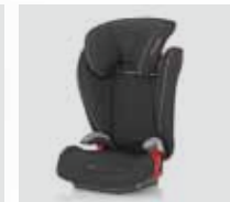
Römer KID plus