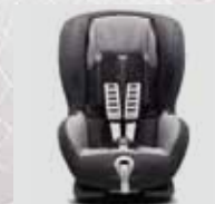
G1 Duo 73700 - 05170 Isofix