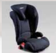
KID Plus F410EYA214